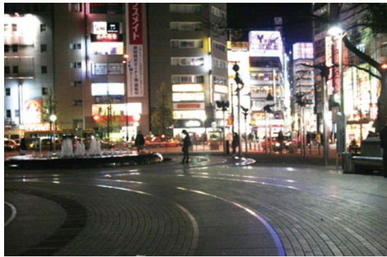
池袋西口公園

みんな、ちよつと、人のせいにしすぎる。上司が悪い。時代が悪い。見る客が悪い、と言って、自分でどつか投げています。でも、投げてしまったらアウトなんですよ。そういう中で必ず見てくれる人はいるし、擁護をしてくれる人もいるので、あきらめずに新しいものを持ち続けてぶつかっていかないと、それを続けないとダメですよ。