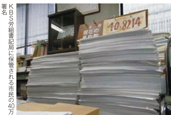
KBS労働書記局に保管される市民の40万署名

——しかし、それは、労働者がどこまで経営に関わるか、という話でもありますね。自分が放送を作っていればそれでいい、というのでもなく、理想だけを掲げて経営を批判するだけでも無理。どうやって具体的な、現実に可能な提言にしていけるのでしょうか。